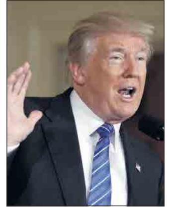
TASTER I VEI: Donald Trump.